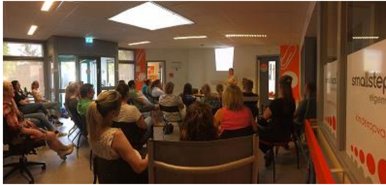
Ouderavond `Een dag bij Smallsteps Eigenwijs